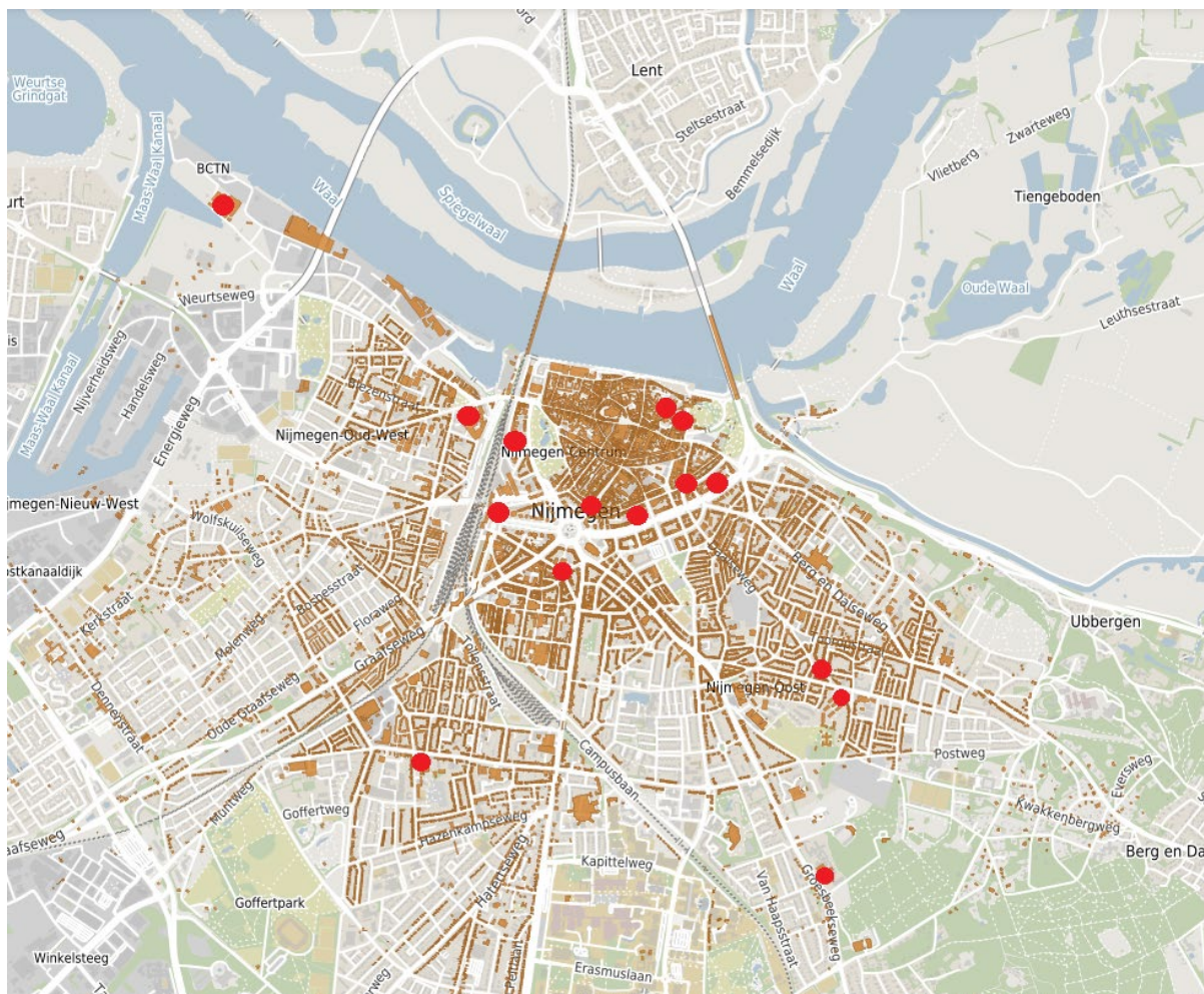
Locaties met op de achtergrond in bruin de bebouwing in Nijmegen in 1944.