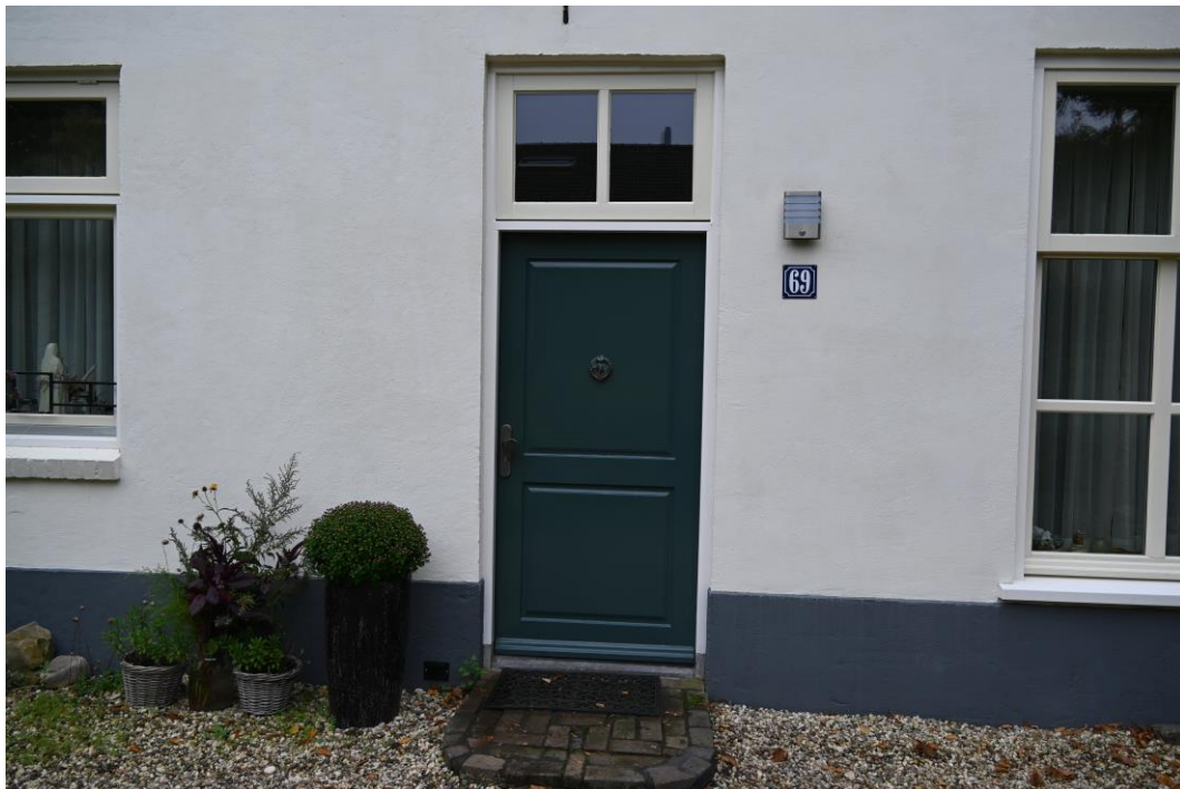
Voordeur in linkerzijgevel.