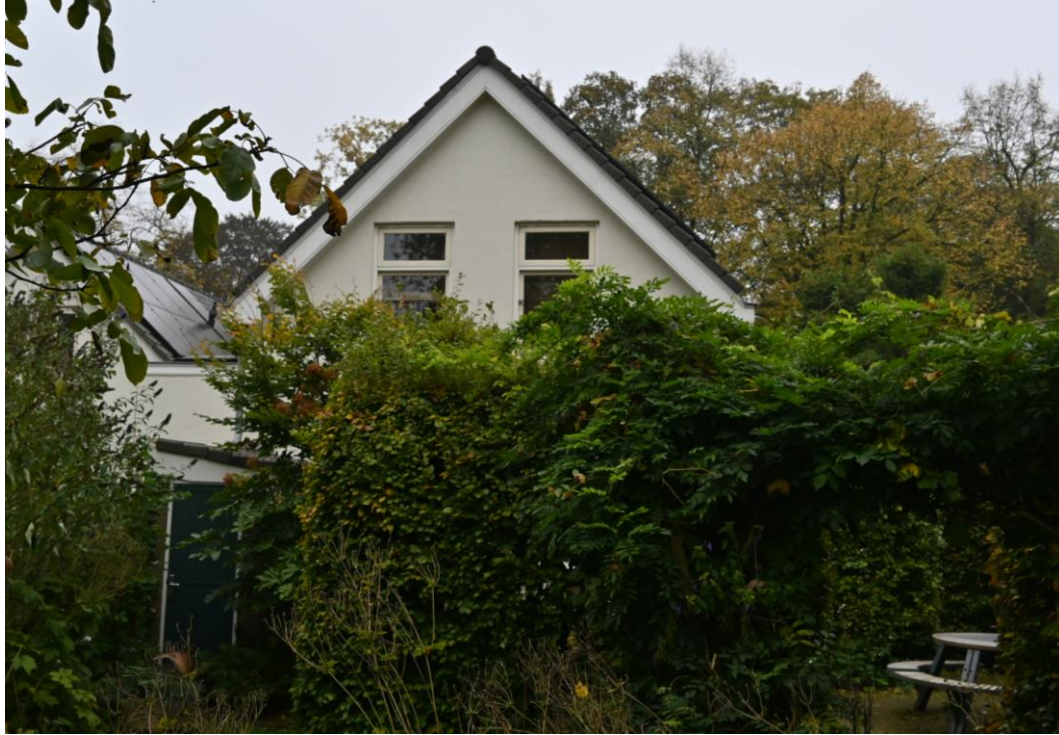
Achtergevel met de aanbouw links.