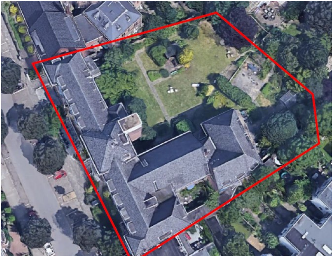
Figuur 1: Foto-impressie van plangebied Van Slichtenhorststraat 91, Nijmegen (Satellietfoto)