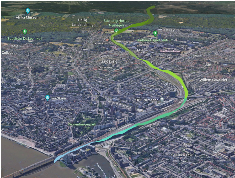
Groene corridor in vogelvlucht (schematische weergave)

De groene corridor langs het spoor is een wandellint dat op steeds meer plaatsen gestalte krijgt in Nijmegen. In de stad liggen van oudsher groen begroeide taluds en andere groene vlakken langs het spoor. De gemeente en bewoners van wijken langs het spoor werken samen om deze groenzones te verbinden, zodat een doorlopend wandellint ontstaat van de Waal tot de bossen van Heumensoord.