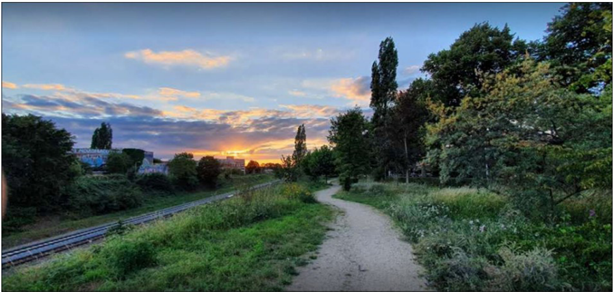
Groene corridor bij Oude Groenewoudseweg

Aan de westzijde van het station krijgt de groene corridor gestalte als een lintparkzone van de Waalhaven tot de Graafseweg. De precieze vorm die dit wandellint gaat krijgen is nog in ontwikkeling: het kan op meer manieren. Bewoners en gebruikers van het gebied kunnen meedenken bij de verschillende projectlocaties, voor een resultaat waar Nijmegen trots op kan zijn!