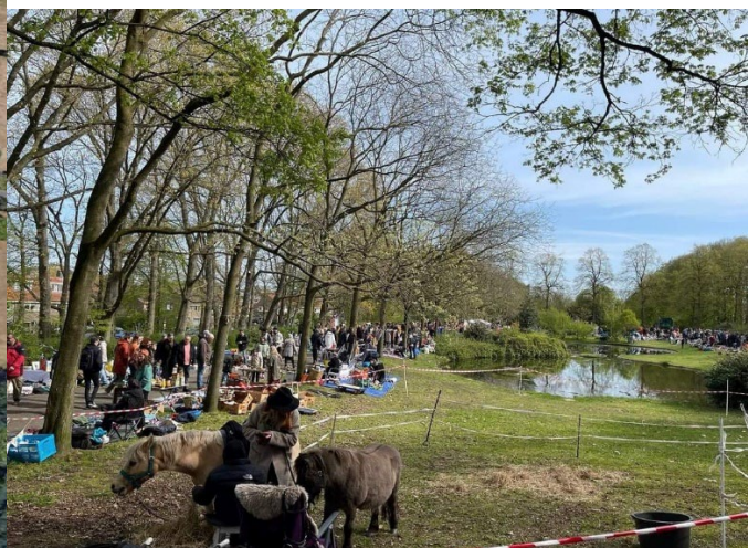
fig. 1 (links); de plek waar de activiteit met de pony's werd aangeboden fig. 2 (rechts); de desbetreffende pony's